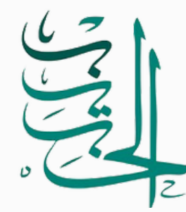
مؤسسة الحبيب الخيرية