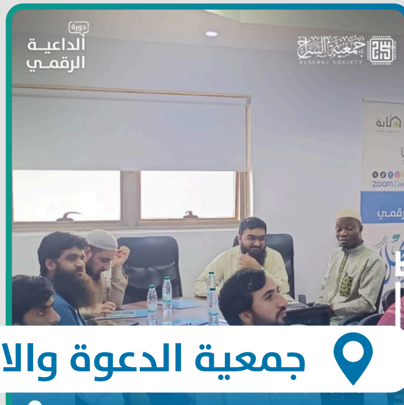
جمعية الدعوة والارشاد وتوعية الجاليات