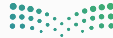
وزارة التعليم Ministry of Education