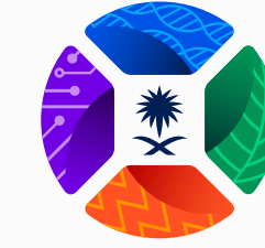
KACST مدينة الملك عبدالعزيز للعلوم والتقنية