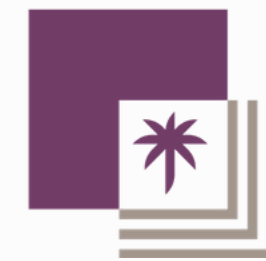
صندوق دعم الجمعيات Associations Support Fund