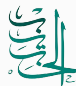
مؤسسة الحبيب الخيرية